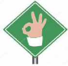
Succes / afgerond