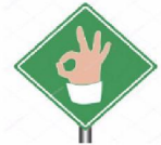
Succes / afgerond